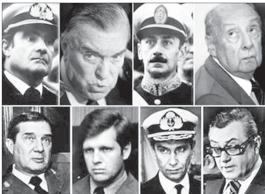
Аргентынскія генэралы і палітыкі, на якіх трымалася хунта

Гішпанскае заканадаўства дазваляе судзіць вінаватых у генацыдзе нават тады, калі яны здзяйснялі злачынствы ў