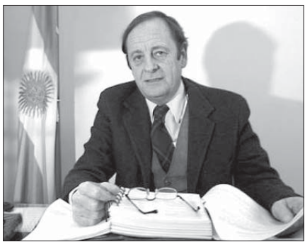
Прэзыдэнт Аргентыны Нэстар Кіршнэр

часу падзеньня дыктатуры прайшло ўжо 20 гадоў. Калі б тое самае зрабілі ў іншых кутках сьвету, магчыма, злачынствы дзеля ўлады здараліся б ня так часта.