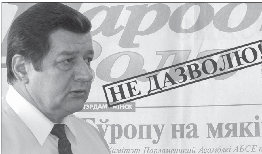
КАЛЖА АРЦЫМА ЛІВЫ

Ад падпіскі на незалежныя выданьні адмовіліся ў другім паўгодзьдзі бібліятэкі Воршы. Міністар культуры Леанід Гуляка, які наведваў горад у траўні, прыгразіў асабіста звольніць з працы дырэктарку Аршанскай ЦБС, калі даведзецца, што бібліятэкі атрымліваюць незалежную прэсу, хай сабе і на пазабюджэтныя сродкі і нават на спонсарскія грошы. На заўвагу бібліятэкараў, што дэмакратычныя выданьні карыстаюцца значным чытацкім попытам, высокі начальнік параіў ахвотным набываць іх у шапіках ды адчыняць прыватныя бібліятэкі. У «чорны сьпіс» трапілі «Народная воля», «БДГ», а таксама абласная незалежная газэта «Вітэбскі курьер».