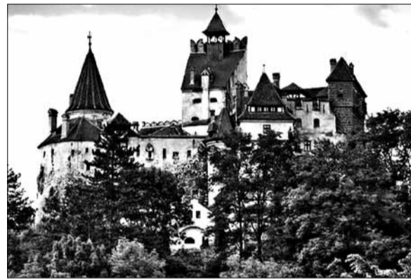
Тіо. by Замак графа Дракулы стаў далейшы на €60