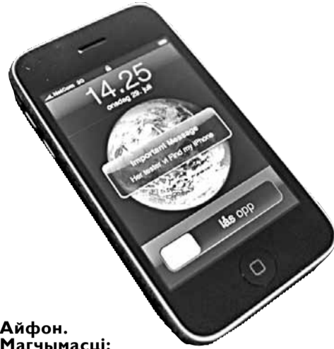
Айфон. Магчымасці: тэлефон, інтэрнэт, аўдыё, відэа, фота і відэакамера

У ЗША, Кітаі і некаторых еўрапейскіх краінах сфармаваўся культ айпадаў. Першы мільён копіяў быў прададзены менш чым за месяц, нават айфоны прадаваліся ўдвая ма-