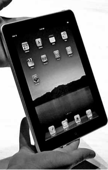
Айпад. Магчымасці: інтэрнэт, аўдыё, відэа, фота і відэакамера, набор тэкстаў праз вялікі сэнсарны экран.

«Айфоны», «айпады», «айподы» — як не забытацца сярод модных навінак?