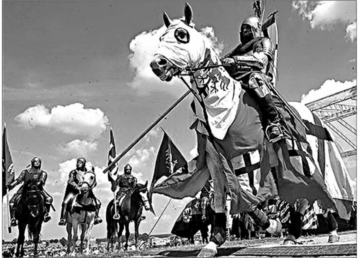
Сённяшні Грунвальд як шоу: штогод на месцы бітвы адбываюцца маштабныя касцюмаваныя пастаноўкі для соцен глядачоў.

кова ўсталявалася назва «бітва пад Таненбергам». Ні Таненберг, ні Грунфельд не былі значнымі населенымі пунктамі, не знаходзіліся там таксама замкі. Але нямецкія крыніцы, называючы Таненберг, указвалі, бліжэй да якога паселішча размяшчалася ордэнскае войска на пачатку бітвы.