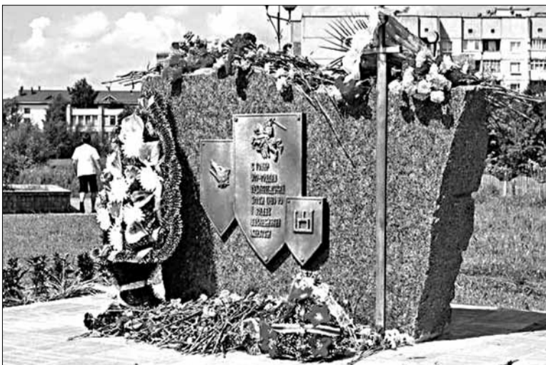
У Ваўкавыску ў выходныя адкрылі помнік у памяць Грунвальда і землякоў, якія біліся там. Факт узсталявання помніка 44 жыхары Ваўкавыска дабіваліся тры гады — яны звярнуліся з гэтай ініцыятывай у выканкам яшчэ ў 2008-м.