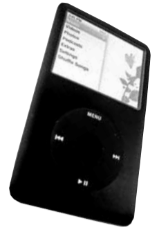
Айпод. Магчымасці: аўдыё, відэа

рудней. У дзень пачатку продажаў ля ўсіх фірмовых крамаў выстройваўца шматсоценныя чэргі людзей, якія гатовыя начаваць пад дзвярыма кампаніі.