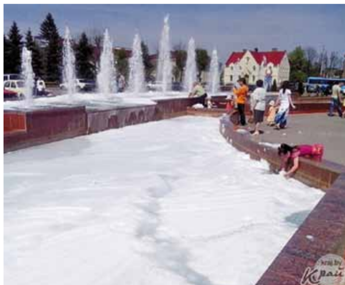
У Вільцы жартаўнік дадаў у гарадскі фантан мыла, той стаў увесць у пене.