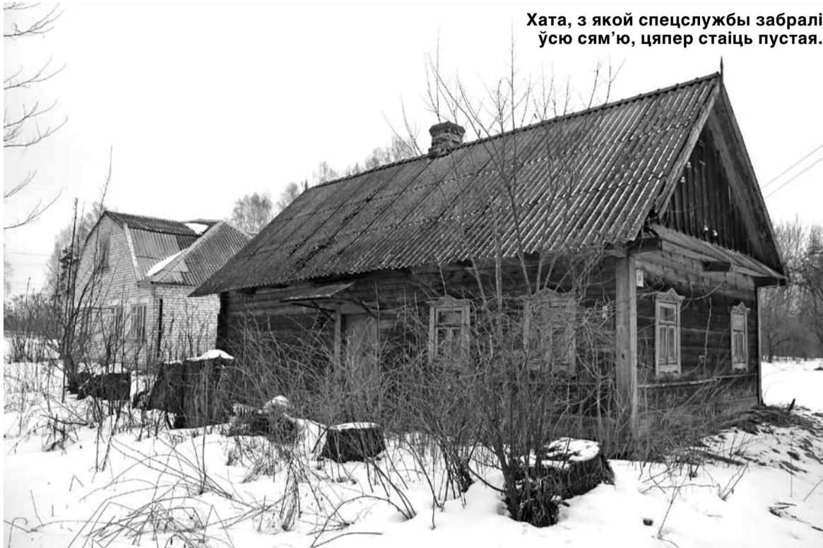
Хата, з якой спецслужбы забралі ўсю сям'ю, цяпер стаіць пустая.

«Гэта ўсё рабілі Сталін і Бярыя. Колькі відных людзей