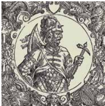
...Віцень пачаў княжыць над Літвой, устанавіў сабе герб і ўсяму княству Літоўскаму пячатку: рыцар збройны на кані з мячом, які цяпер называюць «Пагоня».