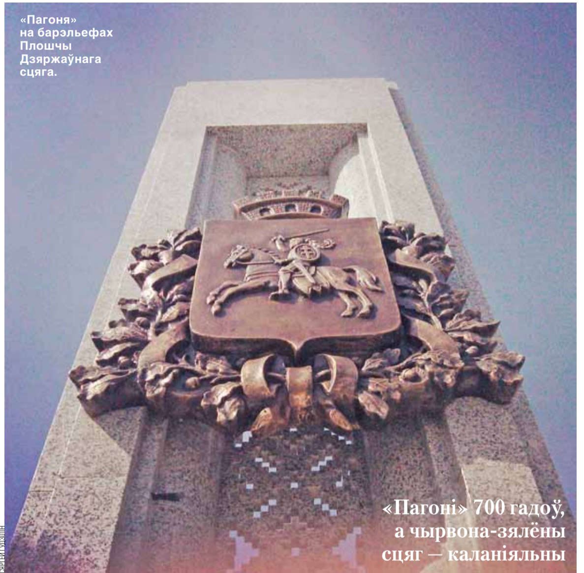
«Пагоня» на барэльефах Плошчы Дзяржаўнага сцяга.

Ён маладзейшы за сівую «Пагоню». Хоць беларусы здаўна шанавалі спалучэнне белага і чырвонага колераў, бел-чырвона-белы сцяг у сённяшнім выглядзе мае канкрэтнага аўтара. Сцяг стварыў