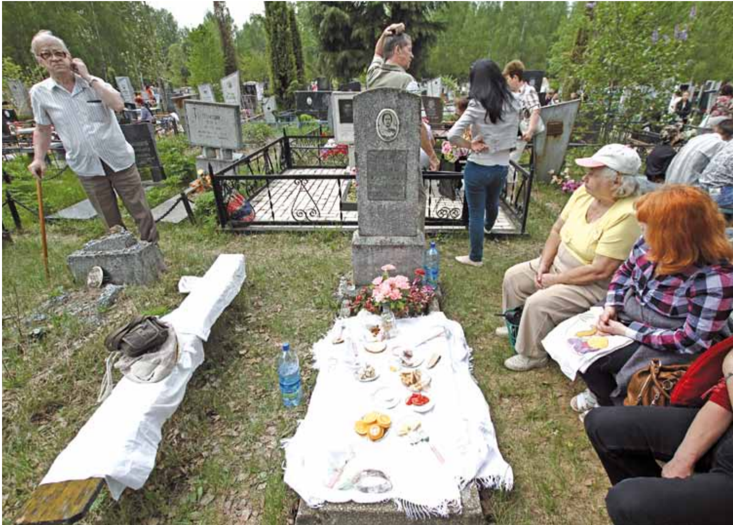
14 мая — Радаўніца. Дзень, калі беларусы ўшаноўваюць продкаў. На Радаўніцу людзі ідуць на могілкі. У многіх мясцовасцях Беларусі існуе традыцыя памянаць людзей абедам на могілках. На фота: Радаўніца ў Барысаве.