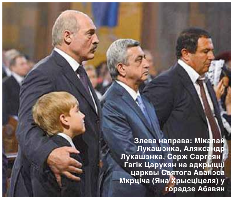
Злева направа: Мікалай Лукашэнка, Аляксандр Лукашэнка, Серж Царукян і Гагік Царукян на адкрыцці царквы Святога Аванэса Мкрціца (Яна Хрысціцеля) у горадзе Абовян