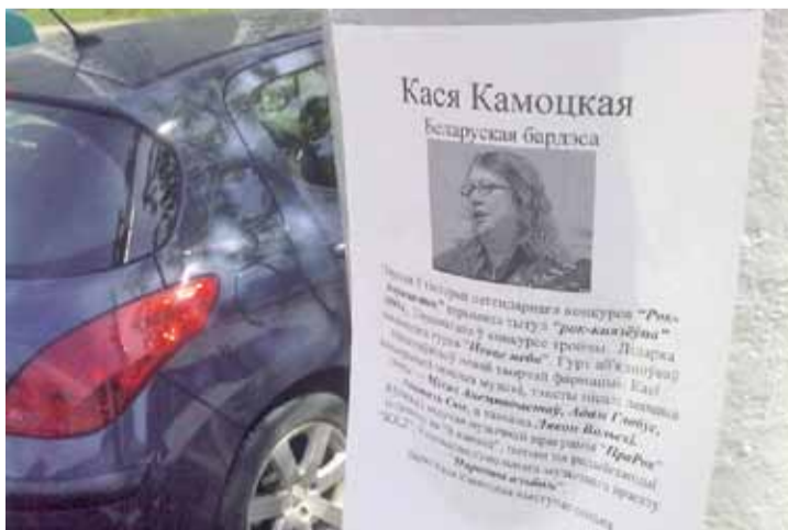
10 мая ў Мінску з'явіліся беларускамоўныя ўлёткі з выявамі і біяграфіяй вядомых беларусаў. Улёткі прымацоўвалі да слупоў, на аўтобусных прыпынках, білбордах. Прынамсі, былі заўважаны плакаты з Касяй Камоцкай, Ларысай Геніюш, Палутай Бадуновай, Галінай Русак, Таццянай Заміроўскай.