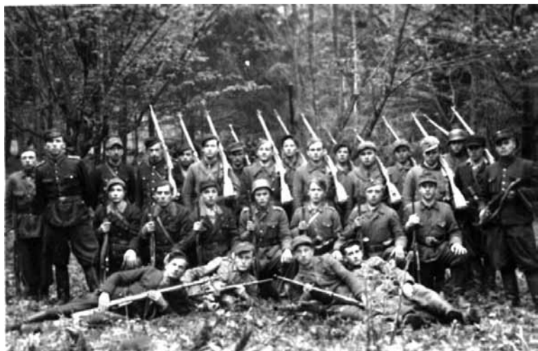
Украінскія партызаны хадзілі па лясках да сярэдзіны 1950-ых.