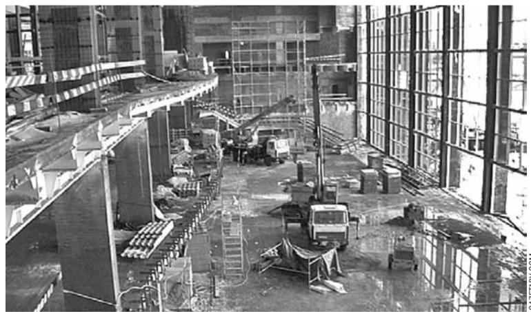
Здымкаў знутры сакрэтнага памяшкання мала, але гэтыя адзінаквыя фоткі даюць уяўленне пра маштабы будаўніцтва.

Аднак падобны ўжо існуе ў Мінску! У мікрараёне Уручча ў канцы 1980-х звезлі некалькі ты-