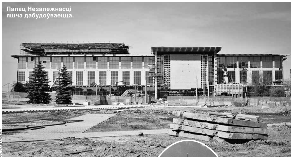
Палац Незалежнасці яшчэ дабудуваецца.

Усяго ж у кіраўніка дзяржавы больш за дзясятка рэзідэнцый — некаторыя жыллыя, некаторыя — рабочыя. Большасць з іх ён атрымаў у «спадчыну» з савецкіх часоў. Гэта і шасціпавярховы будынак ЦК КПБ, загараднае лецішча маршала Цімашэнкі ў Астрашынскім Гародку... У апошнія гады з'явіліся сядзіба ў Палескім запаведніку ды на Браслаўшчыне.