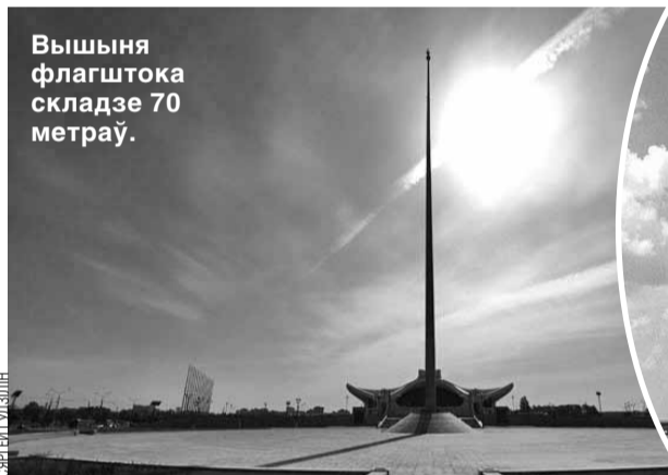
Вышыня флагштока складзе 70 метраў.