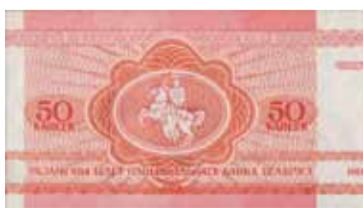
1992. «Пагоня» на першых беларускіх грошах.

Нар. у 1975. Сябра КХП-БНФ. 7 студзеня 2010 вывесіў нацыянальны сцяг на навагодняй яліне ў цэнтры Віцебска. Асуджаны на тры гады ўмоўна. У канцы снежня 2011 зноў арыштаваны і абвінавачаны ў парушэнні рэжыму адбыцця пакарання. За кратамі трымаў сухую галадоўку, ажно яго пачалі гвалтоўна карміць. Вызвалены ў верасні 2012.