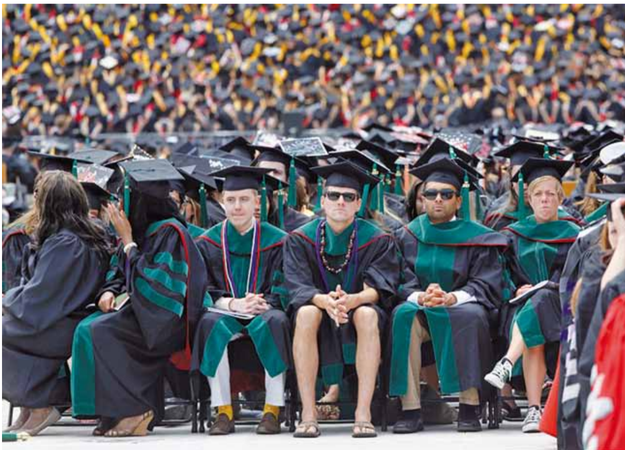
Візіт прэзідэнта ЗША Барака Абама (за кадрам), які 5 мая атрымаў ва ўніверсітэце Каламбуса (Агаё) ганаровую ступень, не збытанжыў мясцовых студэнтаў — некаторыя назіралі за кіраўніком дзяржавы ў кедах, шортах або шлёпках.