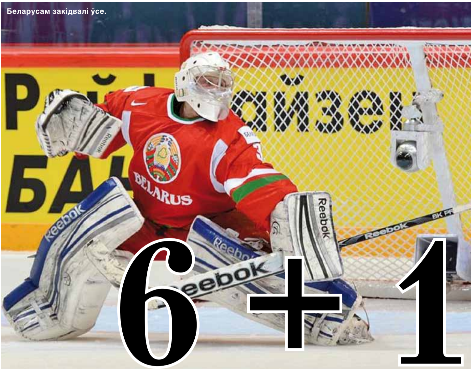
Беларусам закідвалі ўсе.