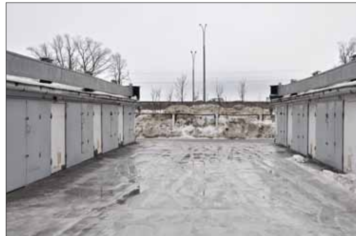
Здымак, зроблены на тым самым месцы карэспандэнтам «НН».