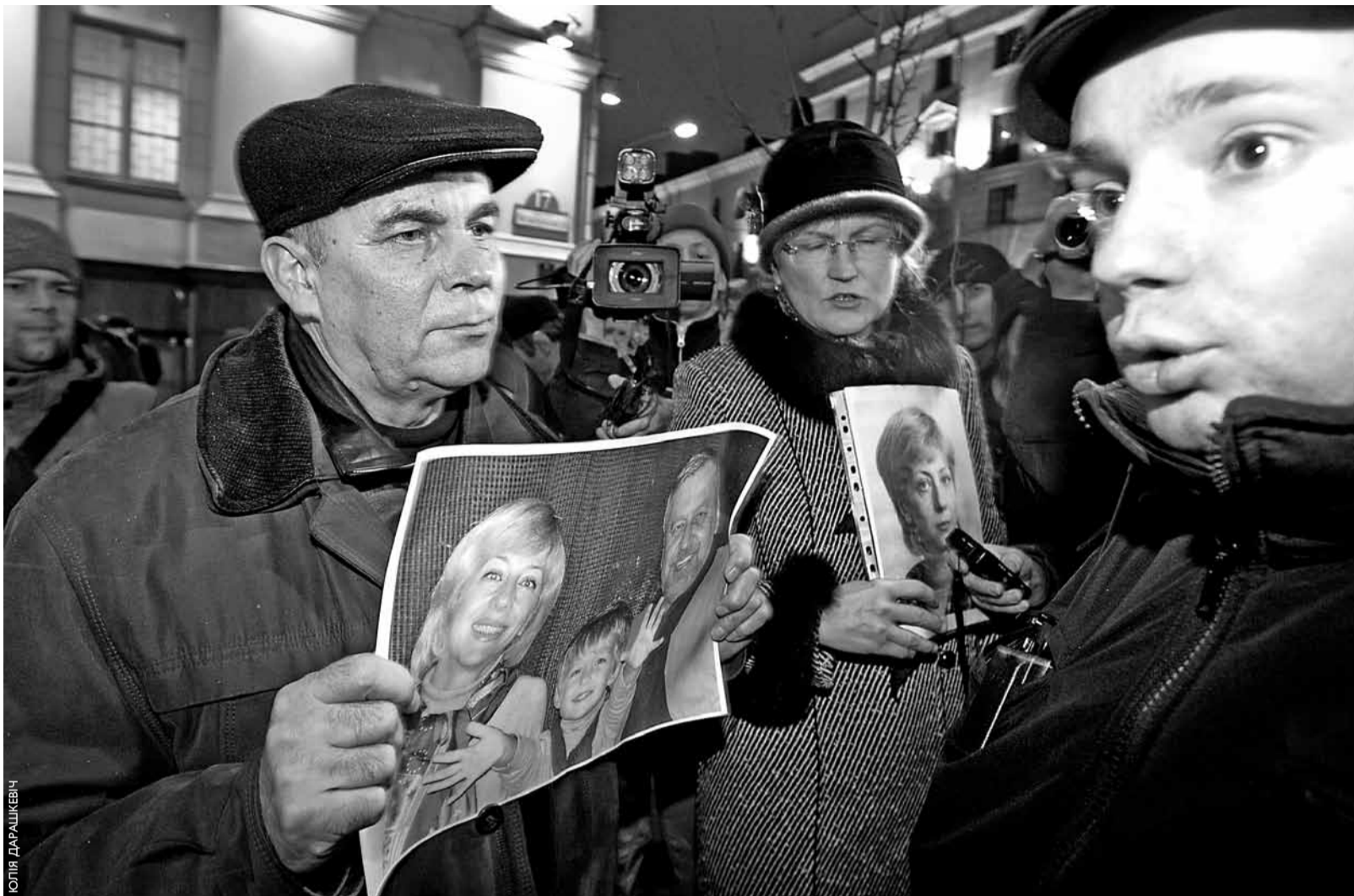
Нягледзячы на масавыя затрыманні на подступах да будынка КДБ, некалькі дзясяткаў мінчан здолелі сабрацца перад ім 19 студзеня. Яны трымалі партрэты палітвязняў. Адначасова 50 чалавек паставілі свечкі каля Чырвонага касцёла на плошчы Незалежнасці. На фота: міліцыянт (справа) крычыць на людзей.