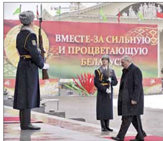
Лукашэнка — 79%. Пустынная вуліца.