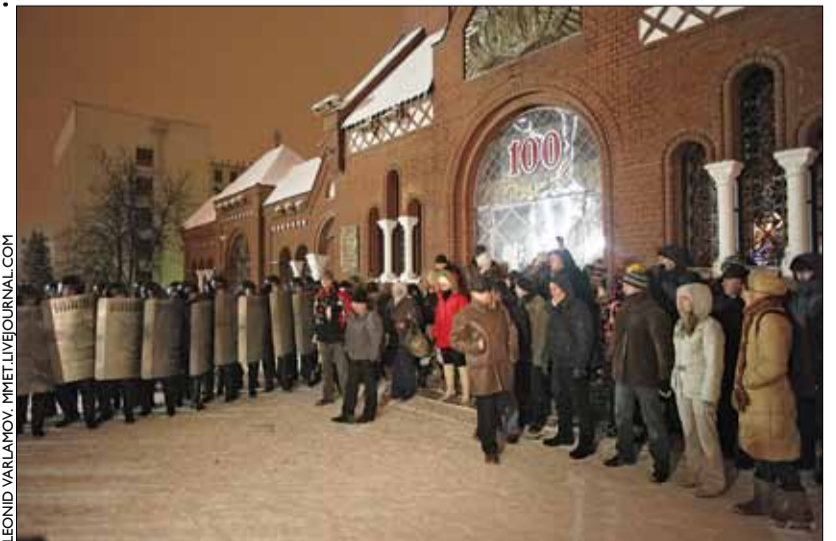
АМОН блакаваў людзей на прыступках Чырвонага касцёла. За імгненне пачнецца збіццё.