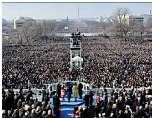
Барак Абама (ЗША) — 52%.

Інаўгурацыі прэзідэнтаў, якія перамаглі з вынікам 52%, збіралі дзясяткі тысяч. Лукашэнка «перамог» з вынікам 79% — і пустыя вуліцы.