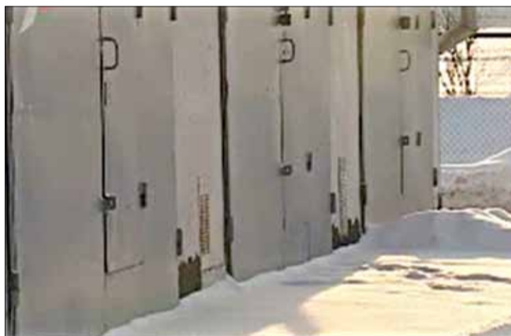
Кадр з фільма «Плошча. Железом па шкле». Звярніце ўвагу, што навіснаго замка на першых ад левага боку дзвярах яшчэ няма, хоць снег перад імі некрануты.