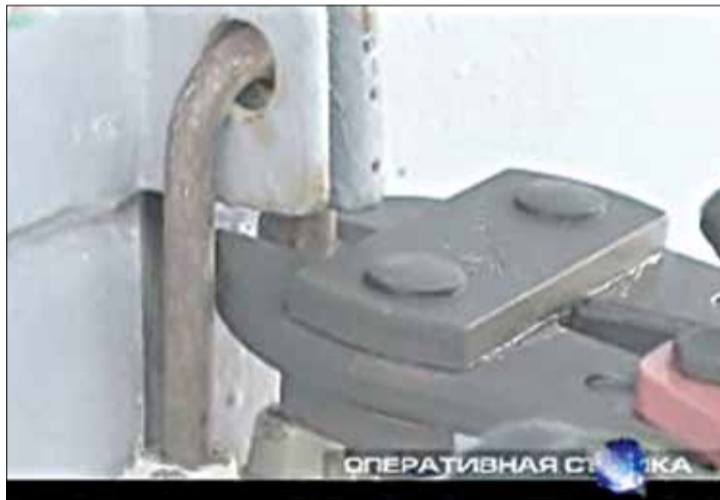
Момант разразаання навіснаго замка. Кадр з фільма «Плошча. Железом па шкле».