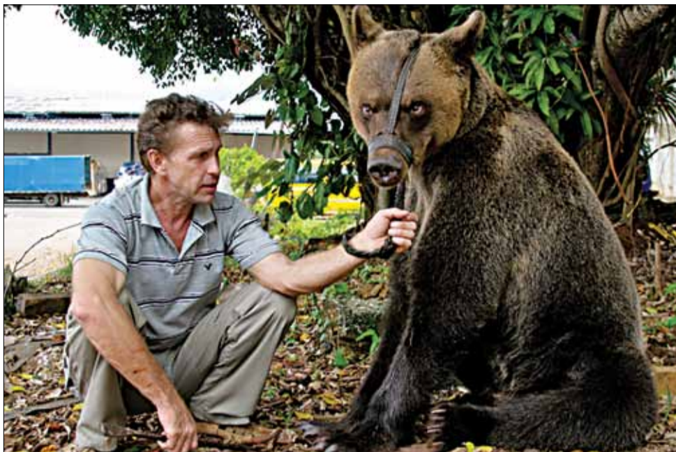
Вось дык сустрэча ў аэрапорце!

*** Яны будуць суправаджаць музычныя інструменты, якія з'яўляюцца часткай музычнай культуры Беларусі.