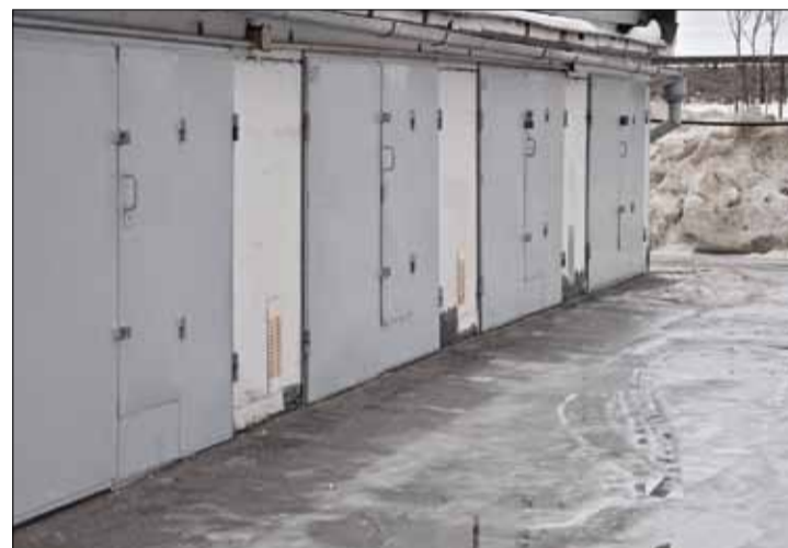
Здымак, зроблены на тым самым месцы карэспандэнтам «НН».