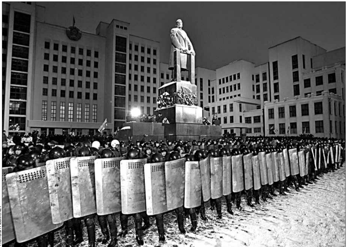
У Беларусі вакол Леніна кіпяць зусім іншыя страсці. На фота: 19 снежня.