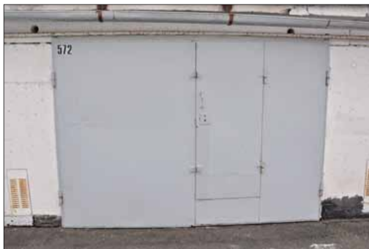
З выгляду — звычайны гараж.