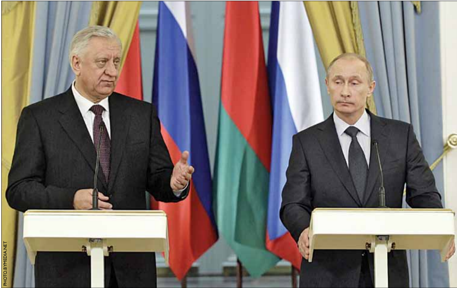
Фініта ля камедыя. Кантракт на імпорт нафты заключаны на ўмовах Расіі. Старонка 4