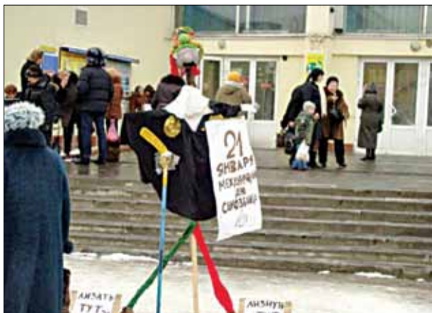
У Брэсце апазіцыянеры на рынку паставілі і каранавалі пудзіла.