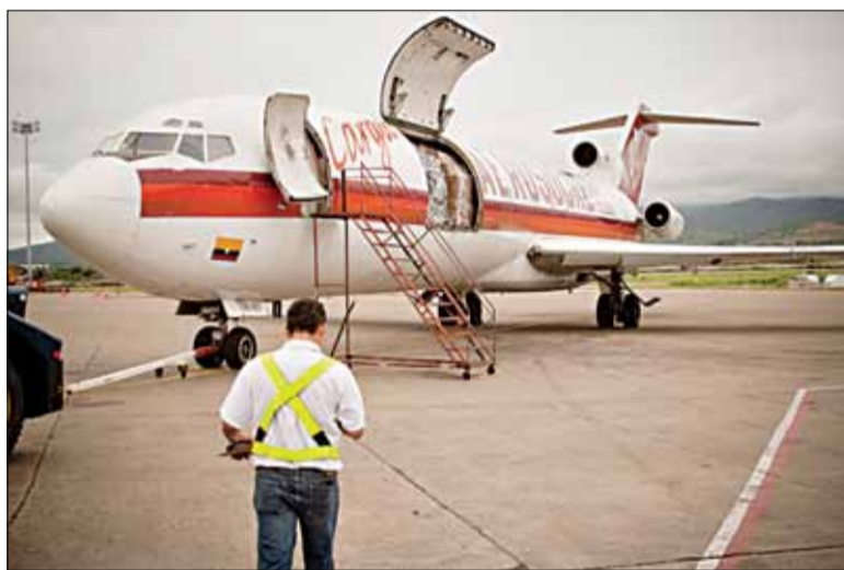
Мы ляцім у Калумбію васьм на гэтым грузавіку.

Макарам засталіся. Авіякампаніі не хочучь браць на борт шасцігадовага мядзведзя. Некалькі месяцаў парачка каляска па Цэнтральнай Амерыцы ў пошукках магчымасці вярнуцца ў Расію. І васьм ужо 19 дзён яны жывуць у гэтым грузавым аэрапорце. Здаецца, з'явілася магчымасць паляцець праз Кубу.