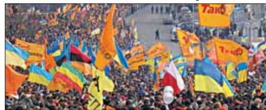
Міхаіл Саакашвілі (Грузія) — 52%.