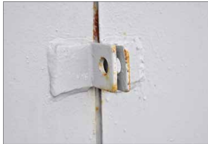
Дзверы таго самага «складу боепрыпасаў». Вушкі для замка можна пазнаць па характэрных кропачках.