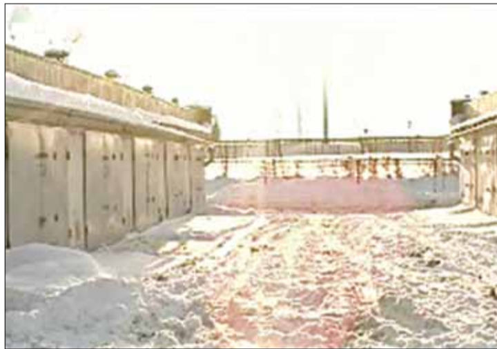
Кадр з фільма «Плошча. Железом па шкле».