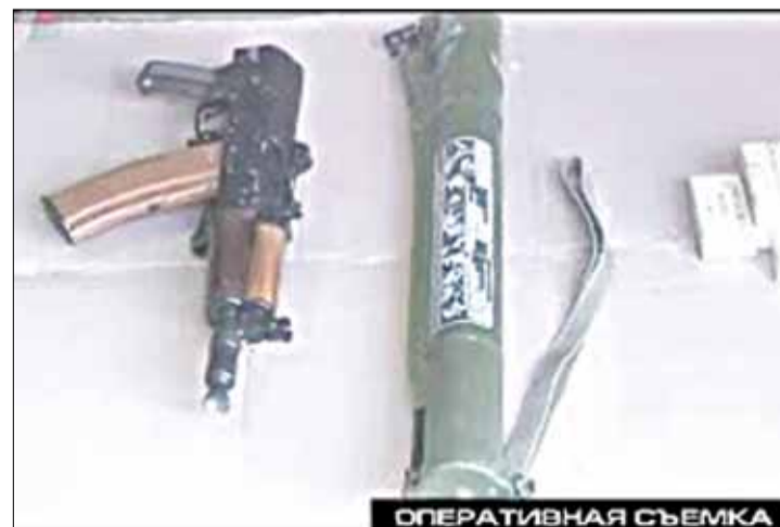
А вось што тут, па версіі БТ, знайшлі спецслужбы.