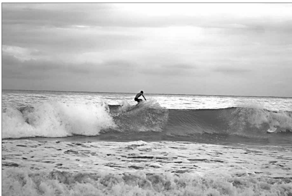
Сёрфінг на Ціхім акіяне.

Калі перасякаеш мяжу на лодцы, адзнаку ў пашпарт не ставяць. У гардуку Пуэрта-Абалдзія ў кагосцы з